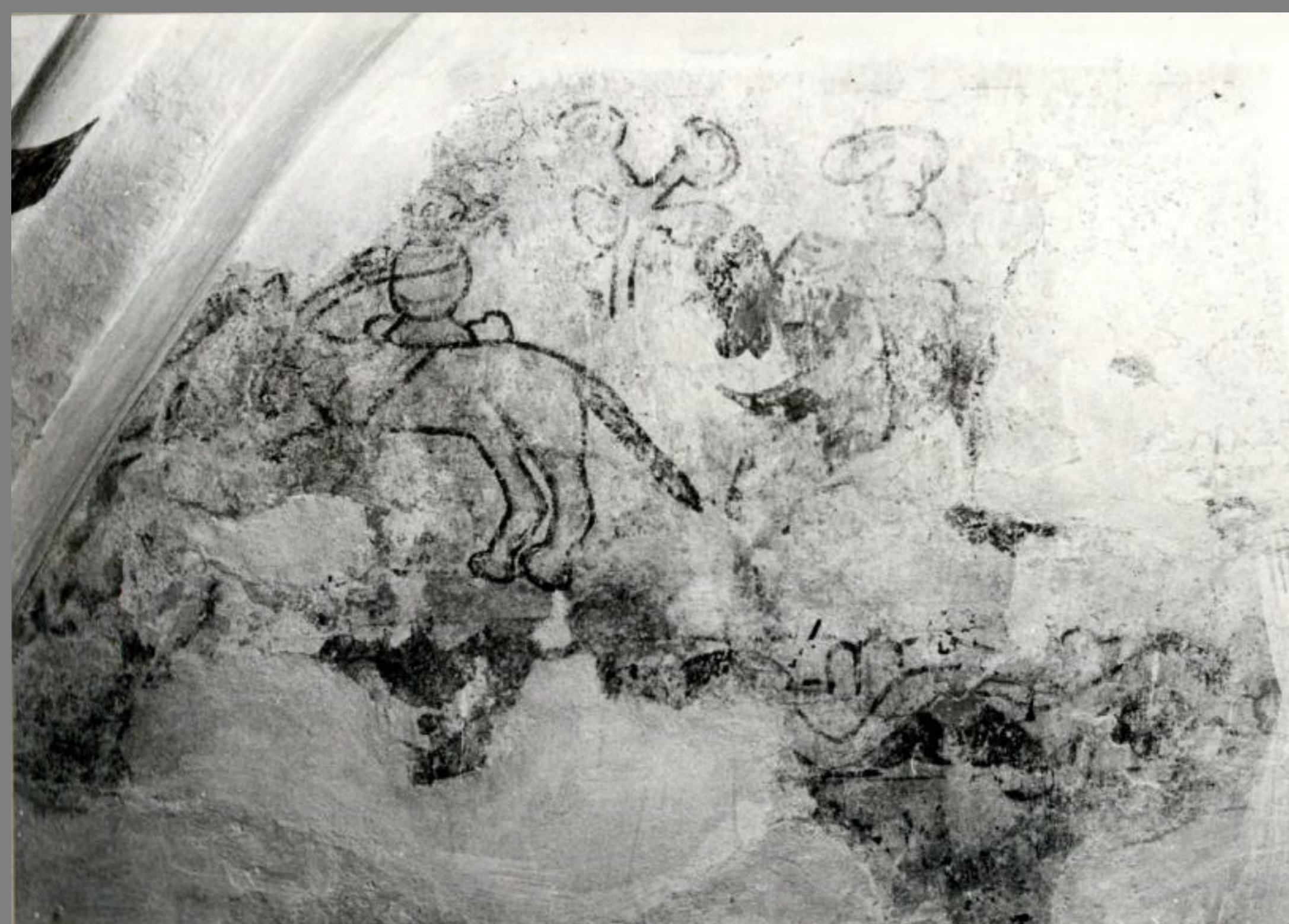
Foto: Nationalmuseets Antikvarisk-Topografisk Arkiv, Jan Gehl, 1966-67

Man afdækkede også et kalkmaleri-fragment fra 1400-tallet, under restaureringen 1967 (stedet ikke angivet) . Det blev også efterfølgende gentildækket.